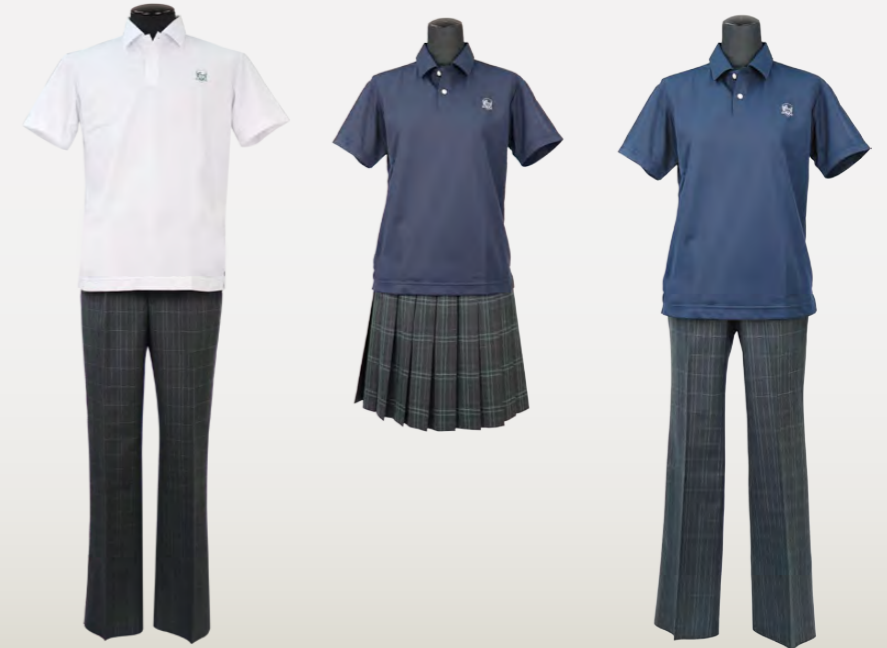
I型スタイル スラックス (従来の男子生徒型)