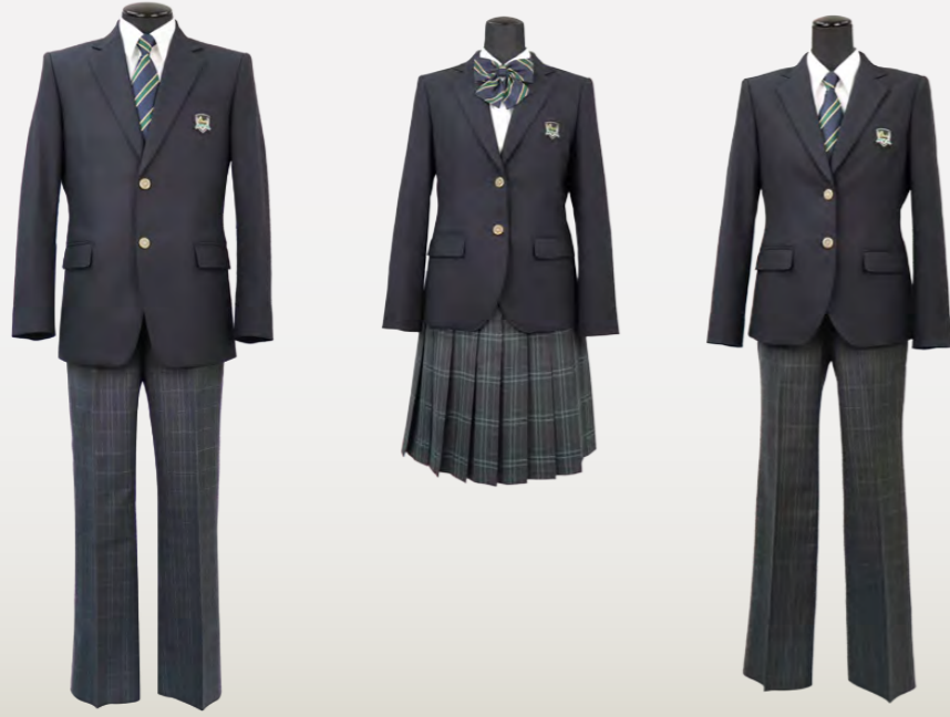
I型スタイル ブレザー スラックス ネクタイ (従来の男子生徒型)

ブレザー (ポリエステル100%) スラックス (ウール30%・ポリエステル70%) スカート